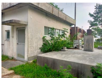
上右・左：笹波・石神営農飲雑用水施設