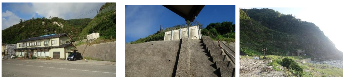
滝見亭（上左）では建物裏にろ過タンク（上中）を設置し、垂水の滝（上右）を水源に水を確保してきた。