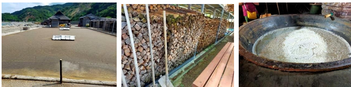
伝統的な揚げ浜式製塩を行う塩田（上左）、近くの山林の薪（上中）を燃料に釜で煮詰める（上右）。