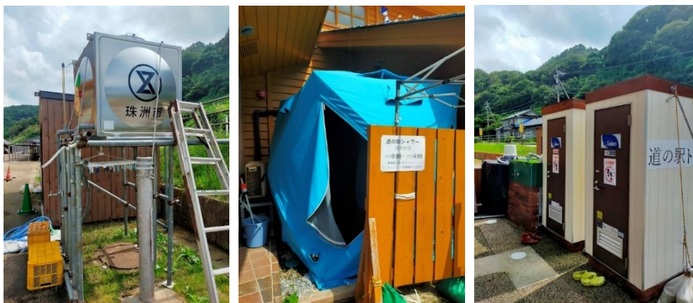
公共施設・道の駅の水関連の応急施設。左から珠洲市設置の給水タンク、WOTA の可搬式シャワー施設、エアコン付き仮設トイレ。