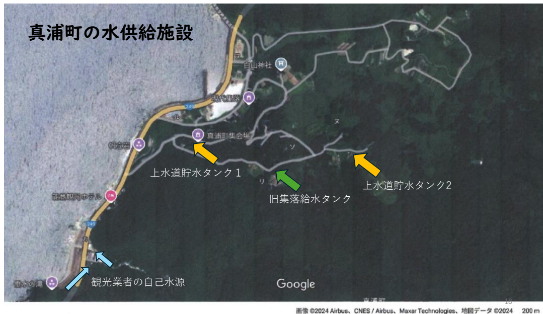
Google Map に加筆

上水道の水源は2町離れた清水町の河川水だが、以前の集落給水の水源は後背山地から流出する湧き水だったという。2軒の観光業者は身近な河川水や渓流水を引水し自家用に確保していた。