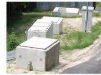
下り茅水道の浄水施設