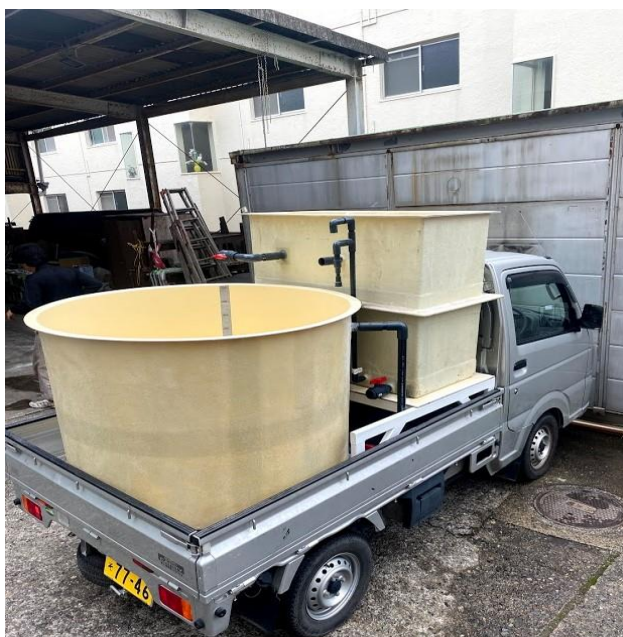
軽トラに積載可能な大きさで濾過池用の容器と貯水タンク用の容器を作成しています。