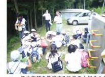
浄水施設を見学する地元の小学生たち