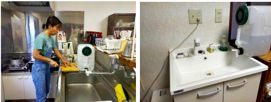
左上：食器の使用は最低限にし、使用後は紙で汚れを拭ってから栓付きタンク水で洗浄。

宿泊時は、地震発災直後から営業を続ける町野町のもとやスーパーで刺身や野菜、総菜を買い出し、宿舎でご飯とみそ汁などを自炊して食卓を囲んだ。刺身の新鮮さ、美味しさは格別。生活用水は使用量を抑えることで炊事も手洗いもとくに困難は感じなかった。入浴は、町野町のピースボートの浴場に行き、初めて仮設入浴施設を体験したが、カラン、シャワーも使え、湯舟では「これぞ、日本の新しい災害文化なのでは」と感激したほど快適だった。