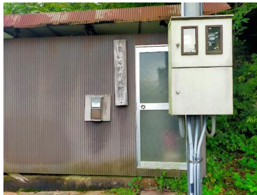
東山中飲用水供給施設（東山中町）のろ過タンク（左）と減菌施設（右）。

珠洲市の上水道未普及地区には別の種類の小規模水道が設置されていることがわかった。 営農飲雑用水施設 という営農用と飲用を兼ねた給水施設で、「 笹波・石神地区営農飲雑用水施設 」と「 八ヶ山（はっかやま）営農飲雑用水施設 」がある。営農飲雑用水施設というのは、畜産・園芸用の水供給を主に飲用水も供給するもので、2002年施行の市設置条例がある。農水省の設置補助金額が大きく、施設規模もりっぱだ。